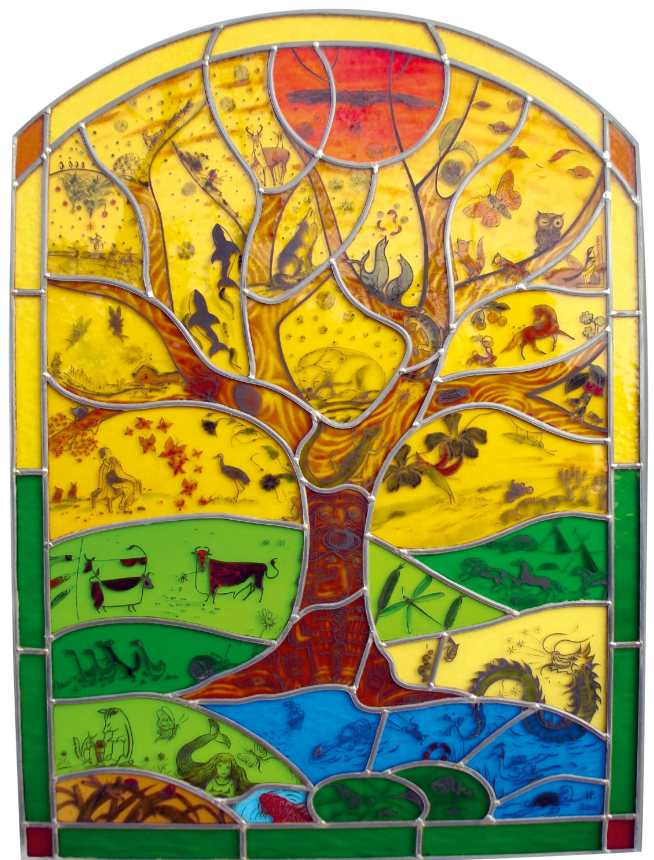
L'arbre de vie Vitrail