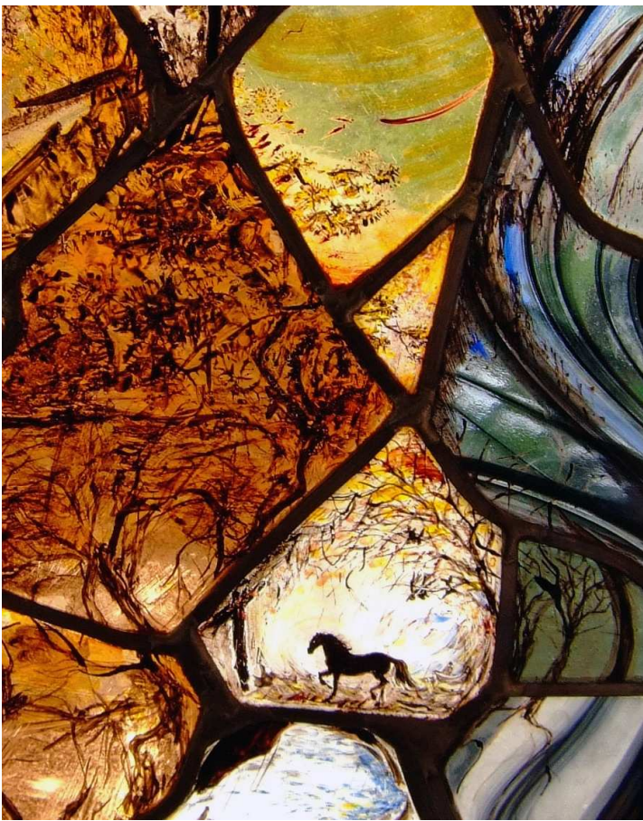
Le passage Vitrail

Rythmées par la vie et ses émotions, ses créations sont inspirées par la nature, les éléments et les saisons.