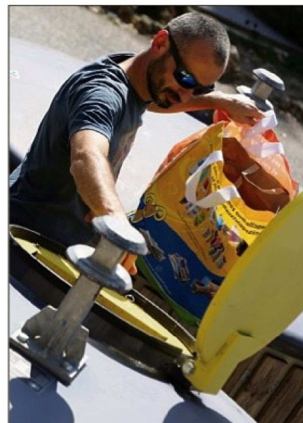
L'unité de traitement interviendra en aval des tris de particuliers.

Toutefois, si les prérequis techniques semblent aujourd'hui validés, il faut encore définir l'architecture du projet, sa gouvernance et passer au travers des procédures d'appel d'offres.