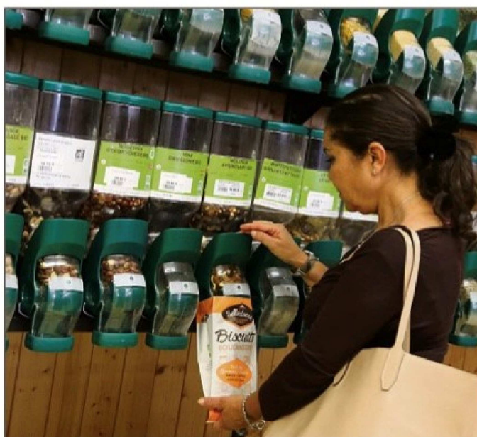
Au rang des pratiques qui permettent de réduire les déchets, les ventes de produits sans emballage.

● 2022 : ouverture annoncée de l'ISDND de Ginasservis. Les déchets qui y seront envoyés seront « surveillés » :